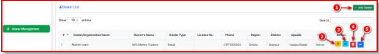
চিত্রঃ ডিলার তালিকা ও উপলব্ধ কার্যক্রমসমূহ