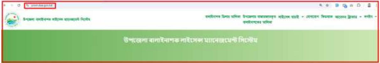
চিত্রঃ ওয়েবসাইট URL