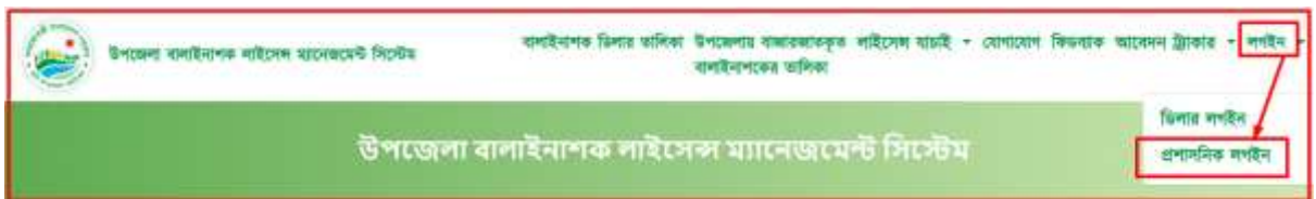
চিত্রঃ প্রশাসনিক লগইন